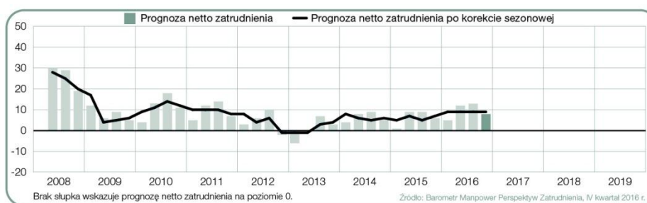
Wykres 1. Prognoza netto zatrudnienia dla Polski w ciągu kolejnych kwartałów. Źródło: Raport „Barometr Manpower Perspektyw Zatrudnienia”.