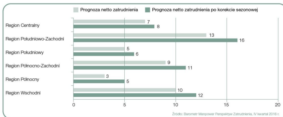
Wykres 3. Prognoza netto zatrudnienia dla regionów Polski na Q4 2016 r.; podział wg Eurostat.

We wszystkich sześciu badanych regionach Polski 2 prognoza netto zatrudnienia dla IV kwartału 2016 r. jest dodatnia. Oznacza to, że w większości kraju przeważa optymizm pracodawców co do planów zwiększania liczby etatów w nadchodzącym kwartale. Najwyższą notę uzyskano w oparciu o deklaracje pracodawców z regionu Południowo-Zachodniego , dla którego odnotowano wynik +16%. Zauważalny optymizm panuje również w regionach Wschodnim oraz Północno-Zachodnim, odpowiednio +12% i +11%. Umiarkowany optymizm odnotowano w Centrum, na Południu oraz na Północy, odpowiednio +8%, +6% i +5%.